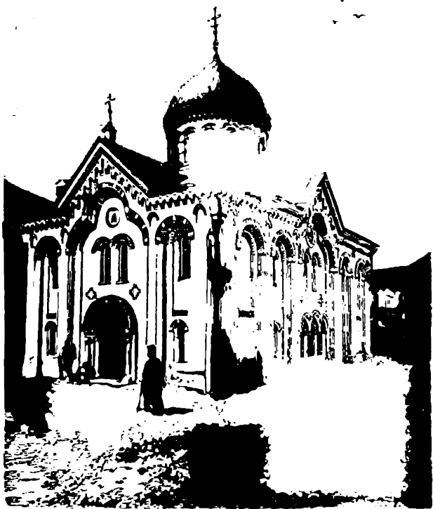
Церковь св. Параскевы (Пятницкая).