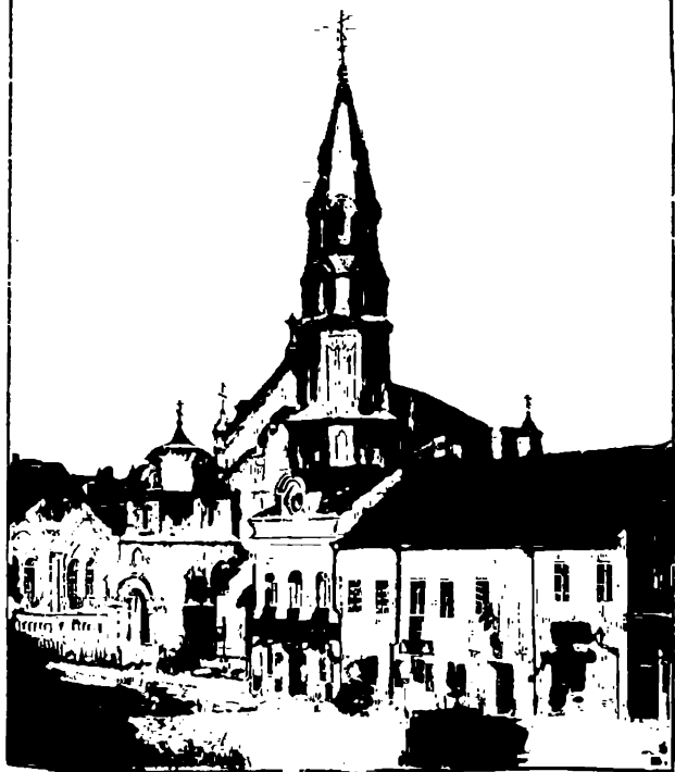
Церковь св. Николая.