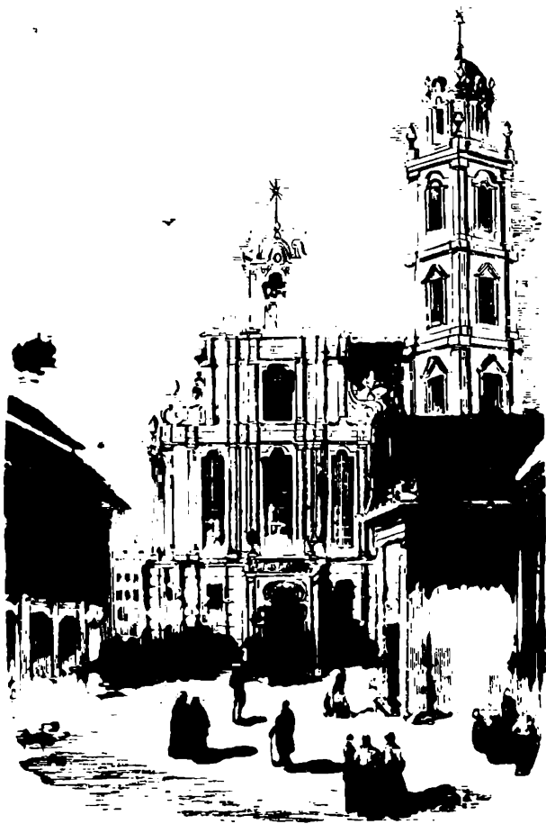
Костель св. Яна.