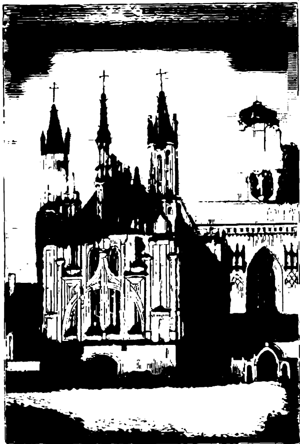
Костель св. Анны.